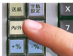
營業稅內/外加可立即切換