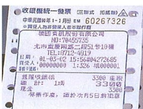
公司抬頭可列印四行